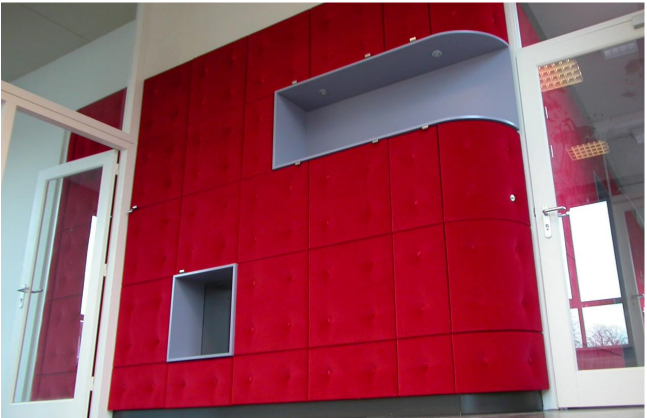
De twee verdiepingen hoge unit bevat alle voorzieningen (toiletten, berging, pantry, server ruimte, kasten, trappen, etc). De buitenzijde van dit 'meubel' is bekleed met rode gecapitonneerde panelen.