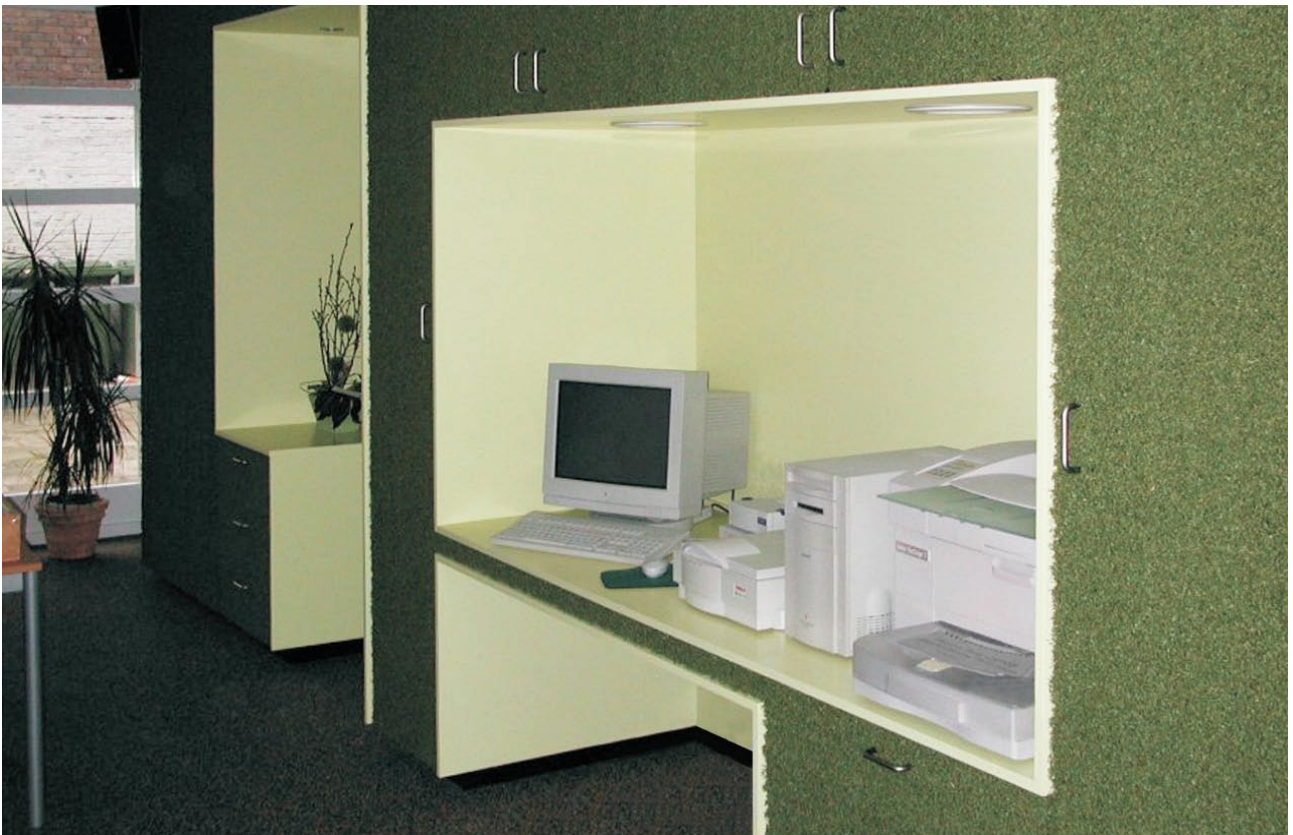
Uitbreiding van Pointer Grafische Vormgeving. De ruimtes rondom het centrale meubel zijn met een zekere terughoudendheid gematerialiseerd (grijze asfaltgrindvloer en wit gestucte wanden en plafond). Het centrale meubel is juist zeer uitgesproken gematerialiseerd; de sculpturale 'gaten', die een kitchenette, overlegruimte, gemeenschappelijke werkplek en doorgang naar een magazijn bevatten, zijn citroengeel gelakt en de schil van het meubel is van donkergroen kunstgras.