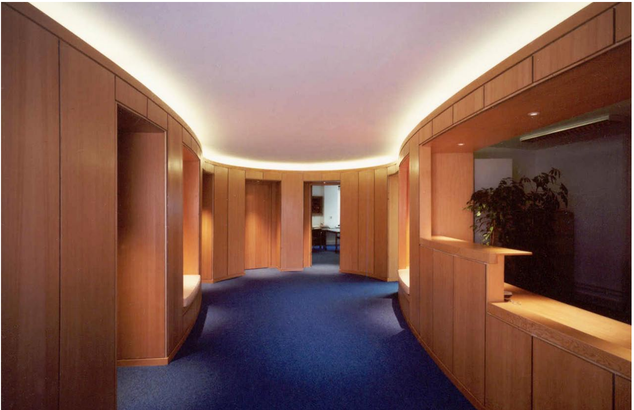
Advocatenkantoor Van der Niet, Leiderdorp. Alle gangruimte is door een gekromde houten wand omgevormd tot een ontmoetings- en wachruimte. Ook de garderobe en balie zijn in dit meubel opgenomen.