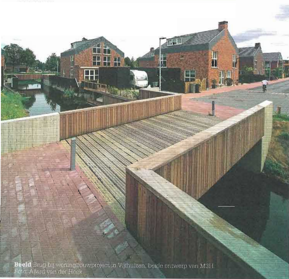
Beeld Brug bij woningbouwproject in Vijfhuizen, beide ontwerp van M3H