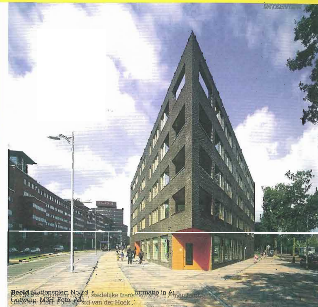
Beeld Stationsplein Noord, stedelijke transformatie in Amsterdam Ontwerp: M3H